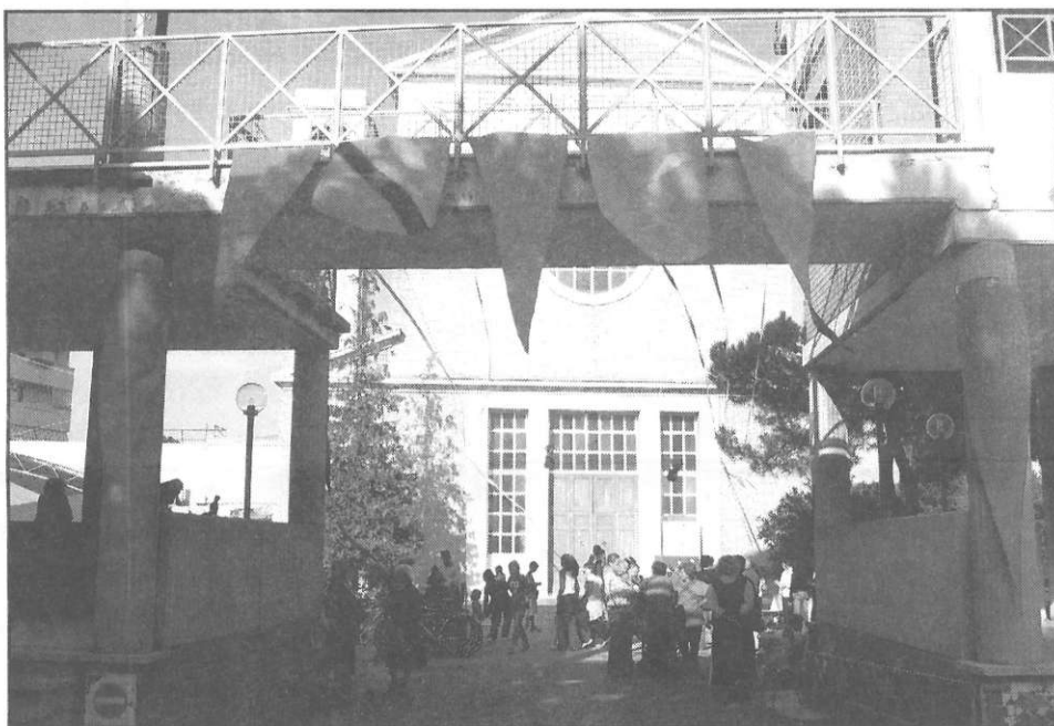
Festa di apertura dell'anno pastorale domenica 25 settembre 2005

Ogni persona e ancor più una comunità, invece, ha bisogno di trovare momenti e ambiti per decidere insieme le scelte